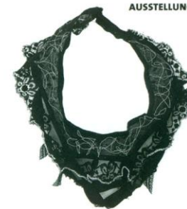
Agnes Czifra: „Barbaras Strumpfgürtel“, 2010. Strumpfgürtel, bearbeitet mit Hand und Maschine, Länge ca. 36 cm

kant Klischees rund um die Themen Mode, Schönheit und „geschmückte“ Weiblichkeit hinterfragen. In Kunststoff, Blattgold und blinkende antike Glassteine der Modeschmuckindustrie eingebettete Magazininfos versprechen Glamour und sind doch Zerrbilder eines Ideals. Vielschichtig sind auch die Arbeiten von Agnes Czifra (*1989, Salzburg), die für ihren frischen und unkonventionellen Zugang zum Thema Schmuck das Stipendium erhält. „Barbaras Strumpfgürtel!“ oder „Gabis Bluse“ heißen ihre Arbeiten: Abgelegte Kleidung, einst hautnah getragen und mit Erinnerung behaftet, werden umgearbeitet zu schmucken Begleitern über ihre einstige Bestimmung hinaus. Sich erinnern, den Blick nach vorn gerichtet, Traditionen fortschreiben mit neuen Inhalten – die Ausstellung im Traklhaus zeigt, dass Schmuckkunst in Österreich lebendig ist, dort, wo man ihr Raum gibt.