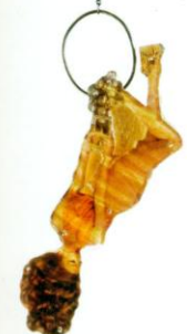
Petra Zimmermann: „Kette mit Anhänger“, 2009. Polymethylmethacrylat, Acrylglas, Blattgold, Silber, geschwärzt. Anhänger: 16,5 x 5,5 x 1,7 cm