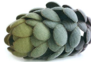
Beatrix Kaufmann: „Hook & Loop“, 2009. Wurfobjekt, gewebtes Polyamid, gefärbt, verformt, Länge 16 cm