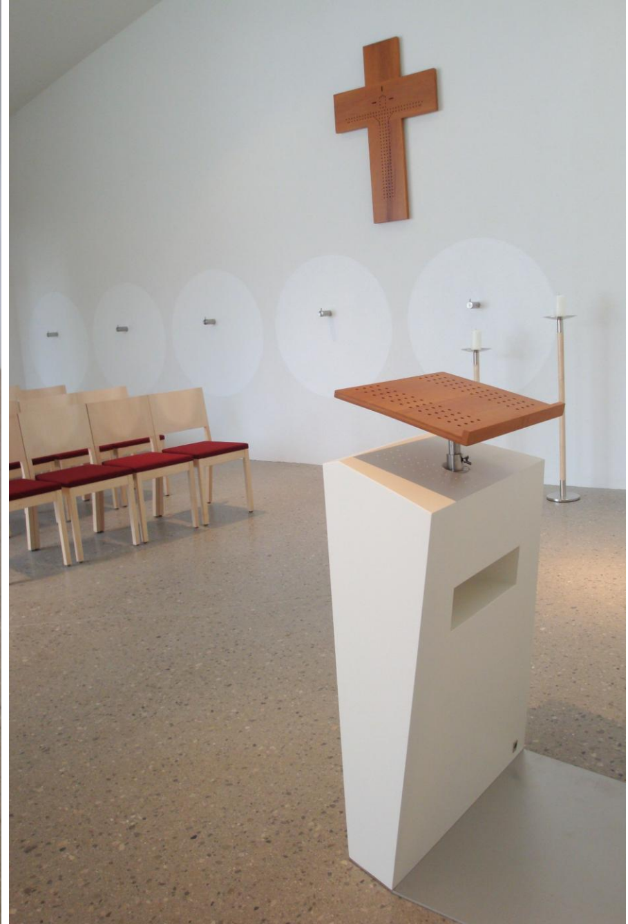
Aufbarungshalle in Großraming / OÖ

Architektur: Wolfgang Schaffer; Glaswand: Gerlinde Miesenböck; Ambo, Kreuz, Kerzenleuchter: Andrea Auer;